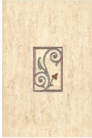
INSERTO VENETTO BEIGE P 23 30 x 45 cm.