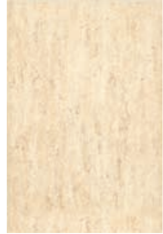
ROMA BEIGE M 13 P 5 30 x 45 cm.