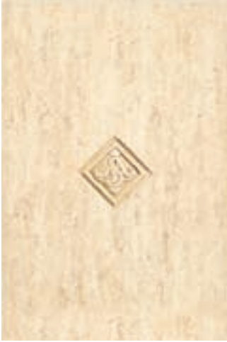
INSERTO PALAZZO BEIGE P 24 30 x 45 cm.