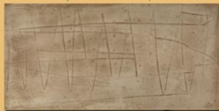
30x60cm 12"x24" alpacca manuale