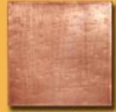
15x15cm 6"x6" rame manuale