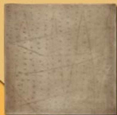
30x30cm 12"x12" alpacca manuale