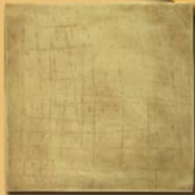
30x30 cm 12"x12" ottone manuale