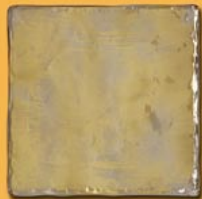
20x20cm 8"x8" Apollo