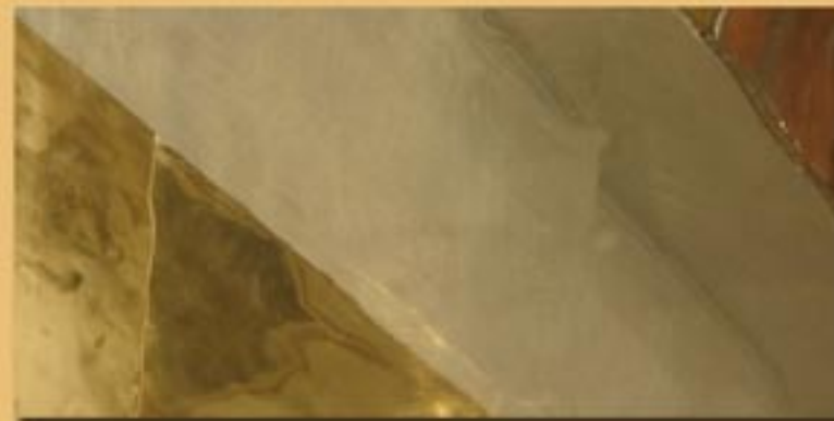
30x60 cm 12"x24" ottone reflex