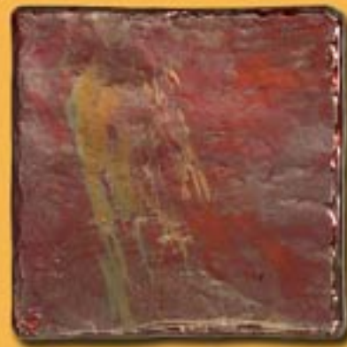
20x20 cm 8"x8" Marte