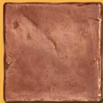
20x20 cm 8"x8" Urano