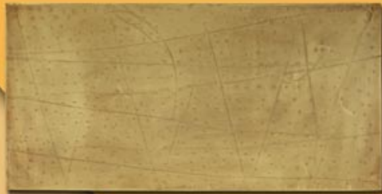
30x60 cm 12"x24" ottone manuale