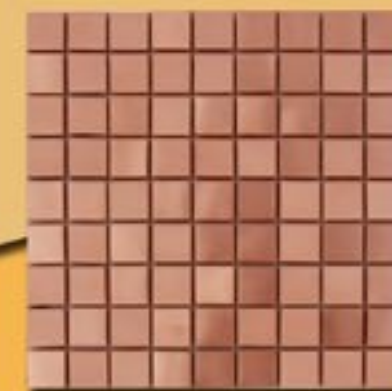
3x3 cm 1"x1" rame satinato su rete 30x30cm 12"x12"