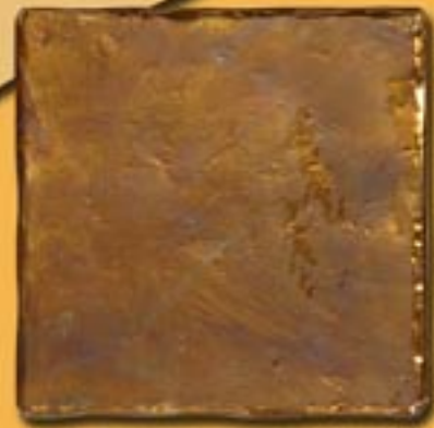
20x20cm 8"x8" Dionisio