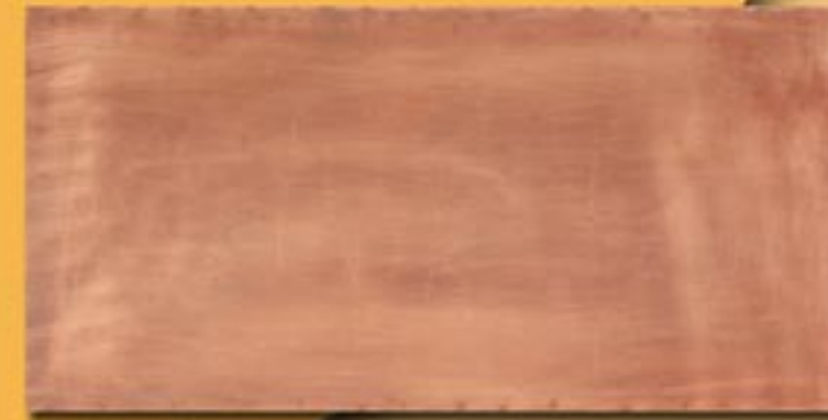
30x60cm 12"x24" rame manuale