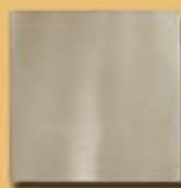
15x15cm 6"x6" alpacca satinato