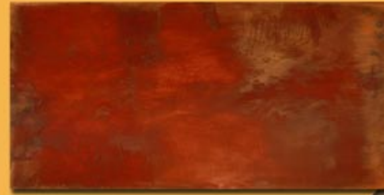
30x60cm 12"x24" rame satinato brunito