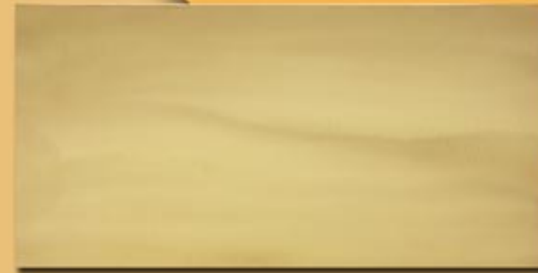
30x60 cm 12"x24" ottone satinato