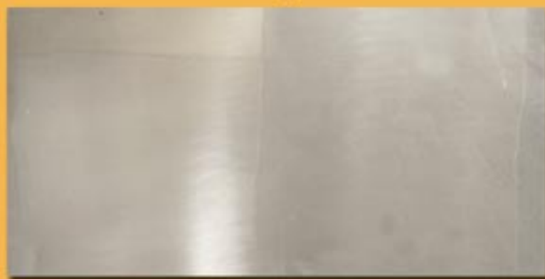
30x60cm 12"x24" alpacca reflex