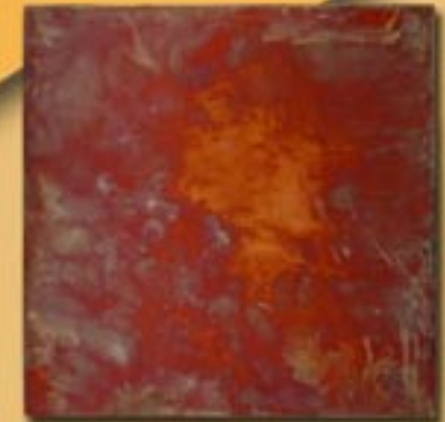
30x30cm 12"x12" rame satinato brunito