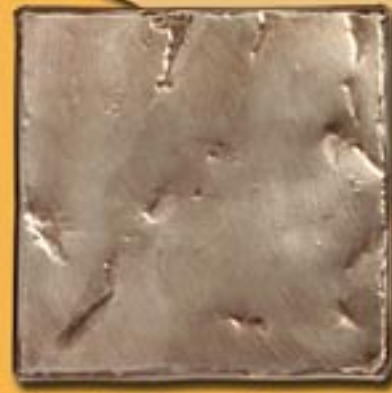
20x20cm 8"x8" Poseidone