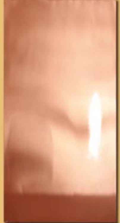
30x60cm 12"x24" rame reflex