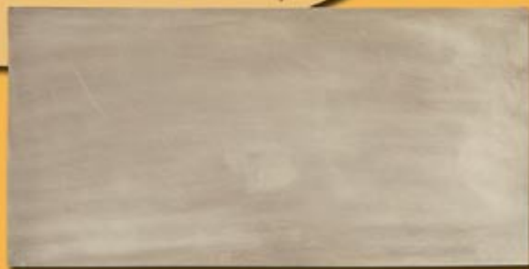
30x60cm 12"x24" alpacca satinato