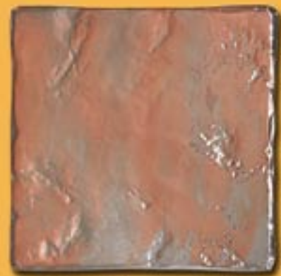
20x20cm 8"x8" Demetra