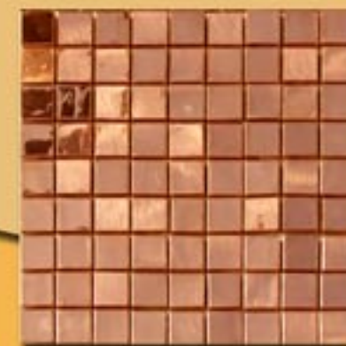
3x3 cm 1"x1" rame reflex su rete 30x30cm 12"x12"