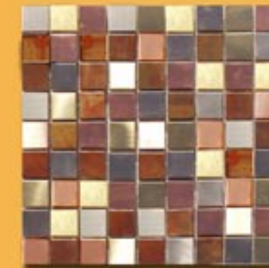
3x3 cm 1"x1" mix su rete 30x30cm 12"x12"