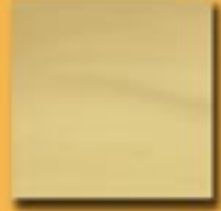
15x15 cm 6"x6" ottone satinato