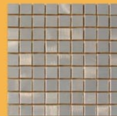
3x3 cm 1"x1" alpacca satinato su rete 30x30cm 12"x12"