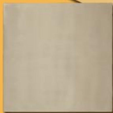
30x30cm 12"x12" alpacca satinato