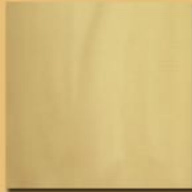
30x30 cm 12"x12" ottone satinato