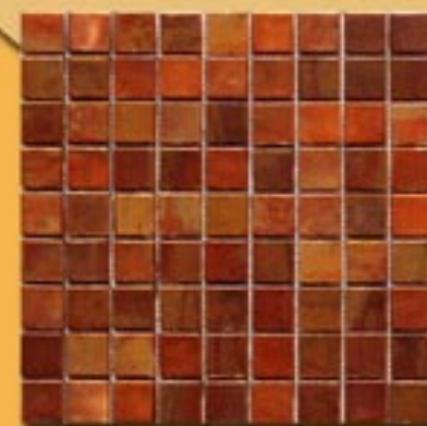
3x3 cm 1"x1" rame brunito su rete 30x30cm 12"x12"