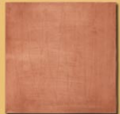
30x30cm 12"x12" rame manuale