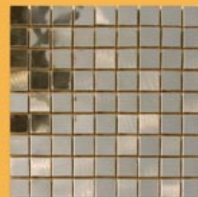
3x3 cm 1"x1" alpacca reflex su rete 30x30cm 12"x12"