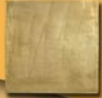
15x15cm 6"x6" ottone manuale