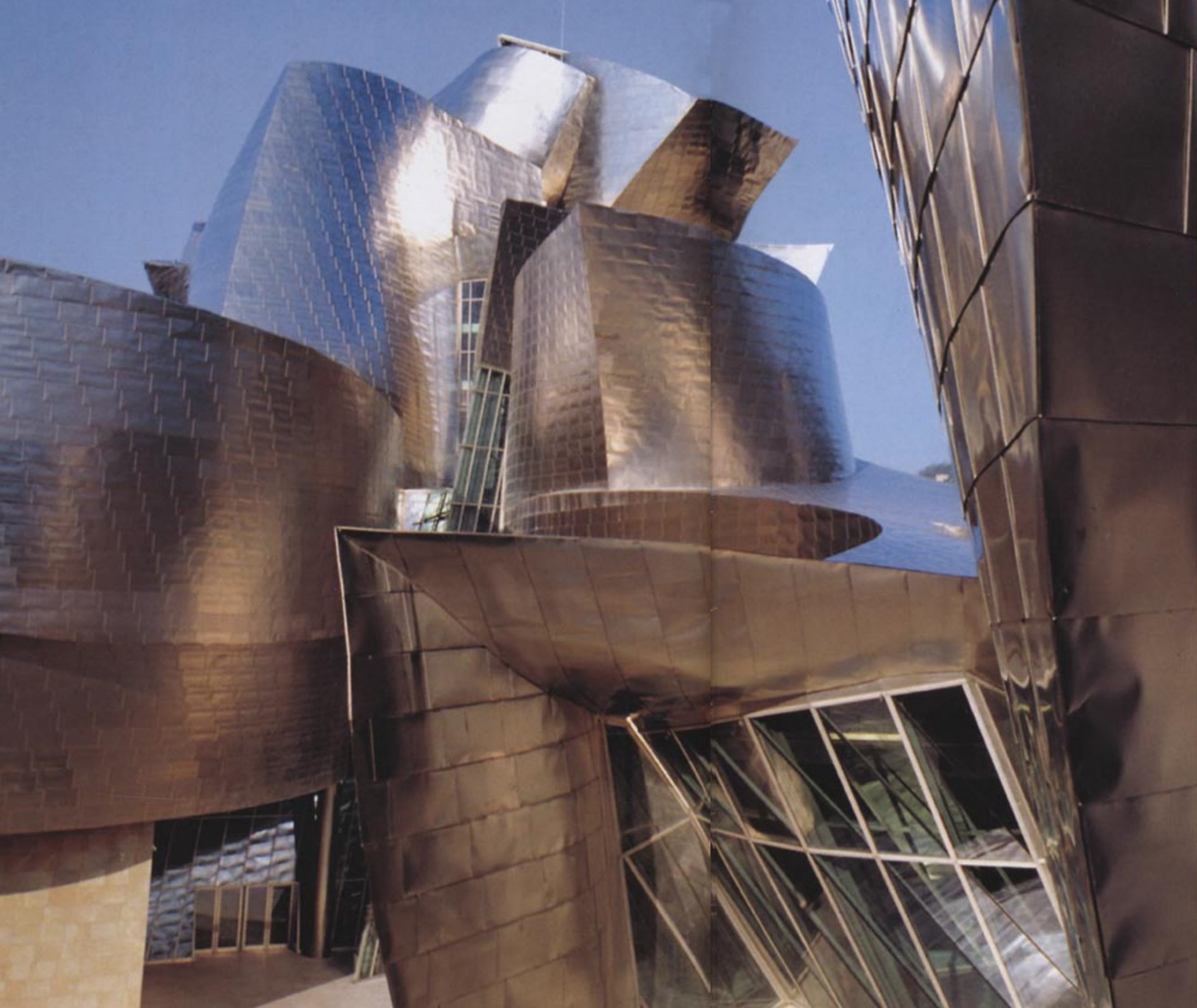
Guggenheim Museum di Bilbao