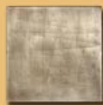
15x15cm 6"x6" alpacca manuale