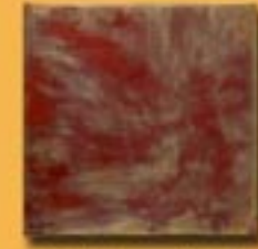
15x15cm 6"x6" rame satinato brunito