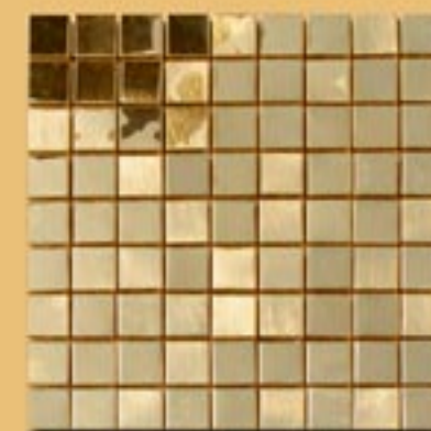
3x3 cm 1"x1" ottone reflex su rete 30x30cm 12"x12"