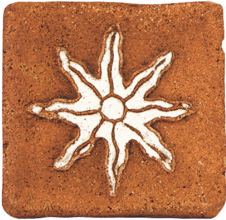
dec stel blanco 10 x 10 ref.C214373