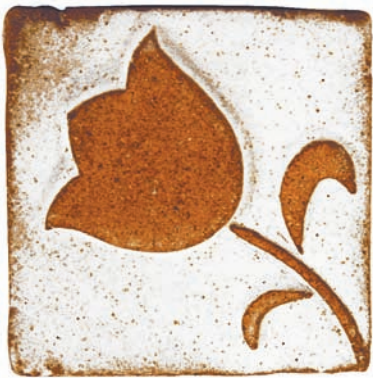
dec amapola 10 x 10 ref.C214369